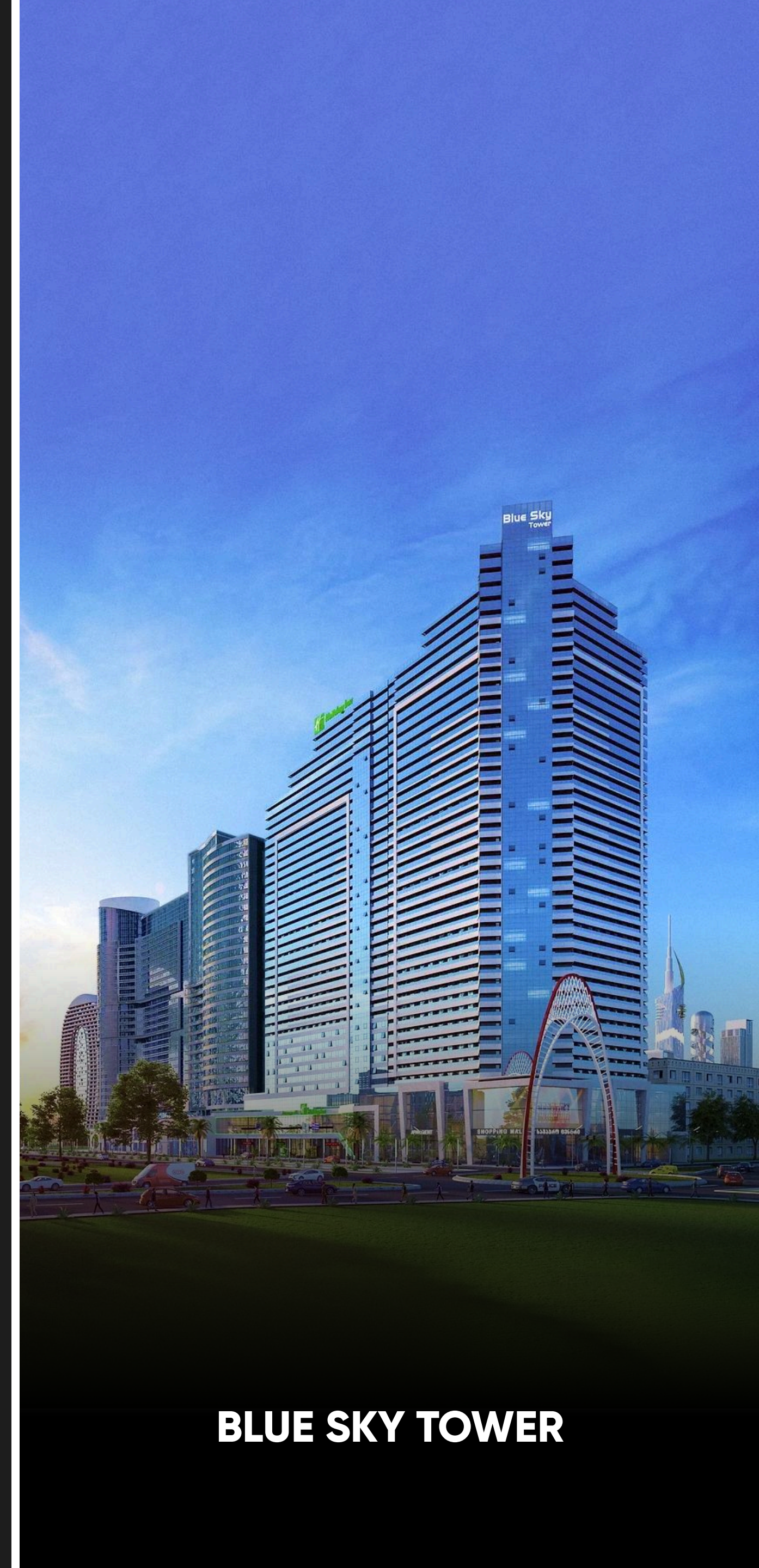
BLUE SKY TOWER