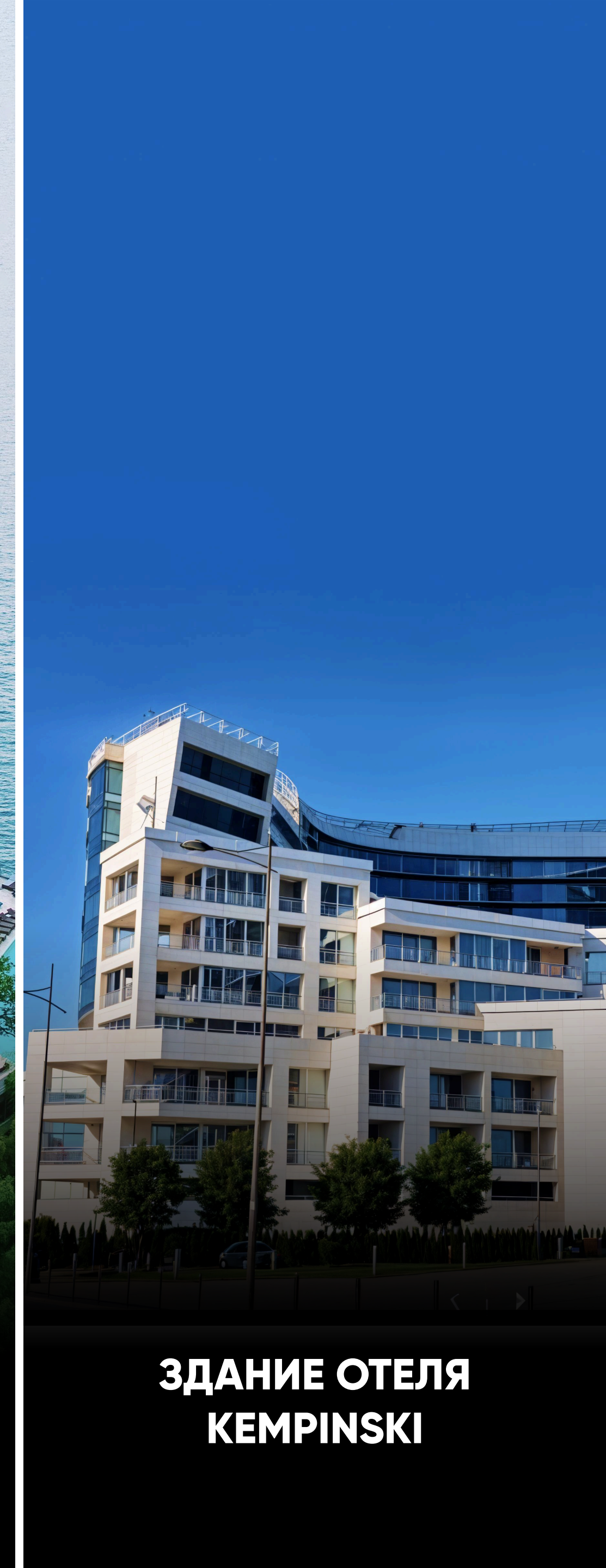
ЗДАНИЕ ОТЕЛЯ KEMPINSKI