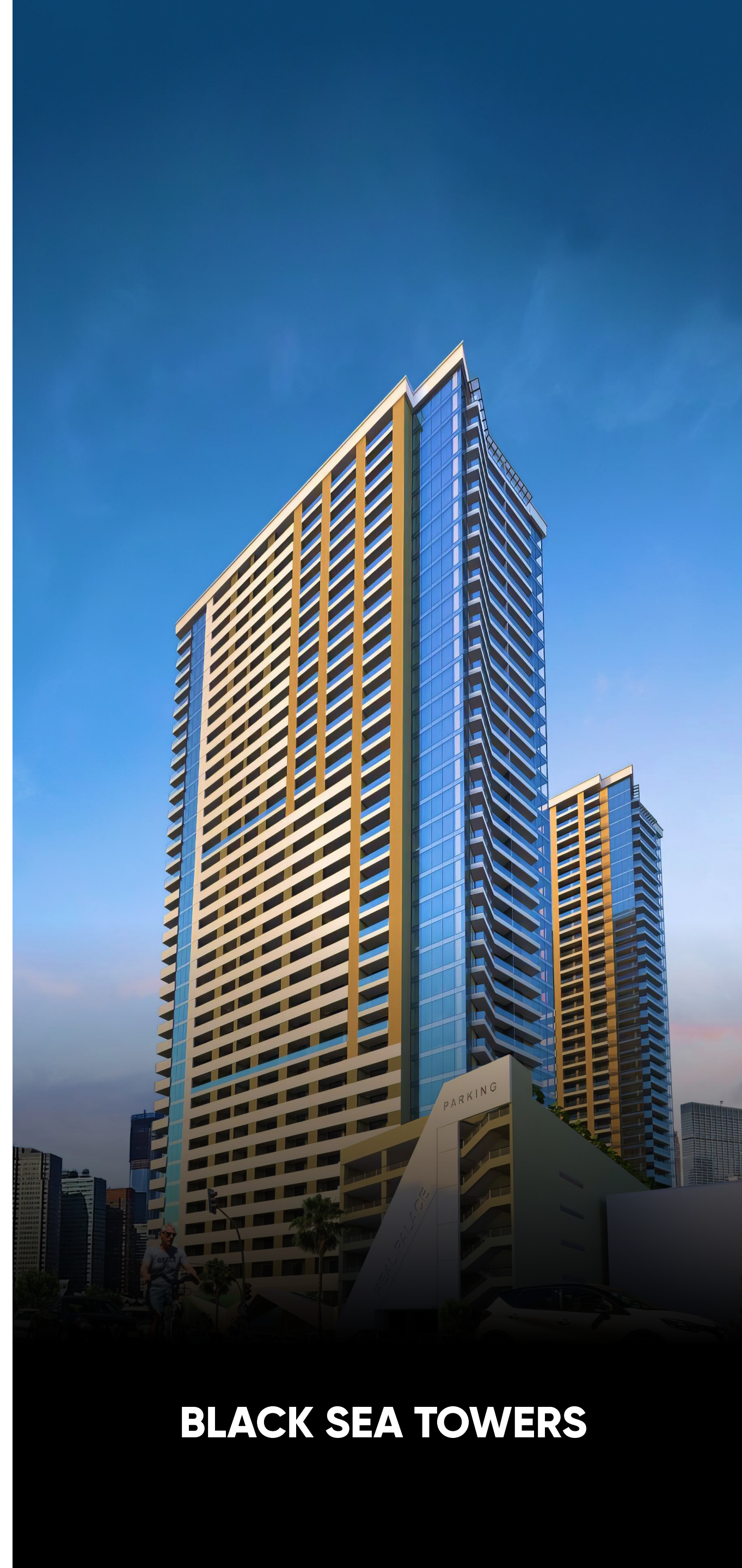
BLACK SEA TOWERS

ПОСТРОЕННЫХ ЖИЛЫХ И КОММЕРЧЕСКИХ ОБЪЕКТОВ