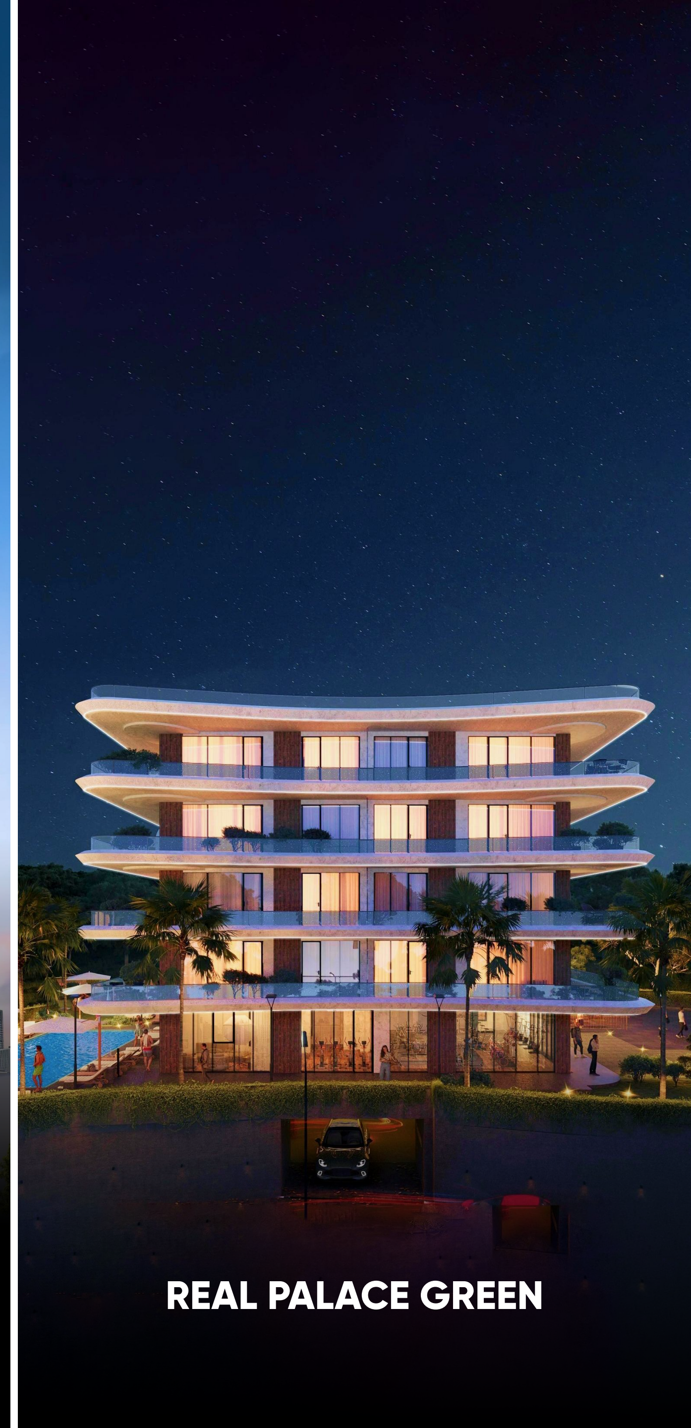
REAL PALACE GREEN